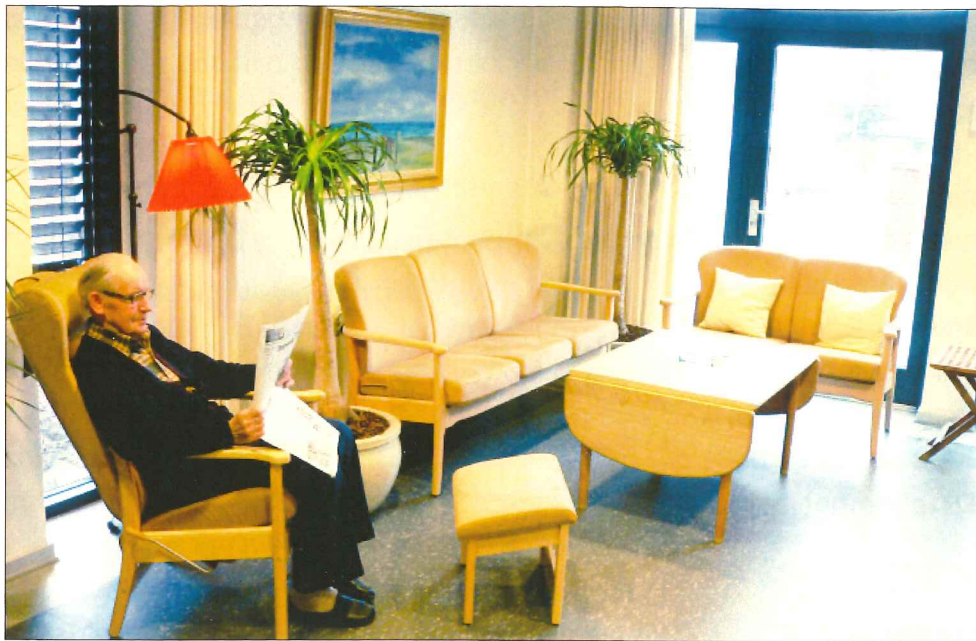
De nye fællesrum i Fynsgadecentret er lyse og venlige.

De beboere, der i dag flytter ind på ældrecentre er gamle mennesker, som har behov for bistand til at få hverdagen til at fungere, og beboernes bidrag til fællesskabet kan variere meget afhængig af, hvad den enkelte formår.