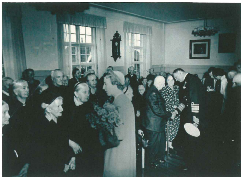
Kong Frederik den 9. og Dronning Ingrid hilser på beboere fra Plejehjemmet Fynsgade i 1951.

enkelte beboers liv, som de tidligere tiders bestyrerinder ofte var. Størstedelen af personalet har i dag en sundhedsfaglig uddannelse.