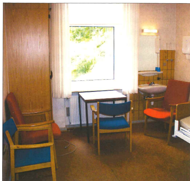
Stue på Plejehjemmet Fynsgade før renoveringen.

Ældrekommissionen, der var nedsat mellem 1979-82, betegnede lommepengeordningen som umyndiggørende.