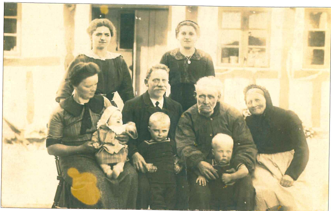
Landbofamilie omkring 1916.

Der var ikke hjælp til at klare de personlig fornødenheder, og var man i stand til det, skulle man deltage i de daglige opgaver med holde huset kørende.