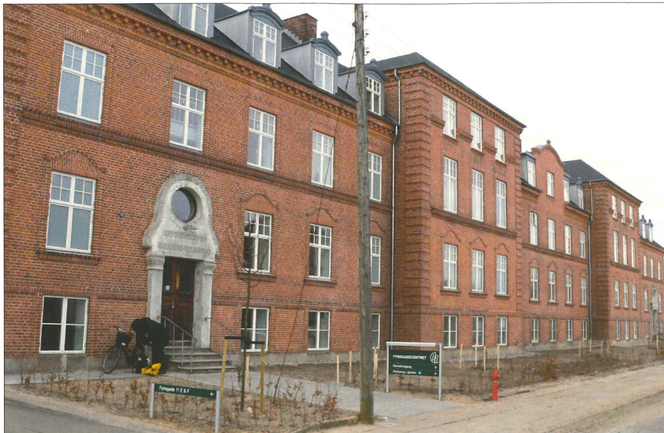
Fynsgadecentret anno 2006.

Blandt andet på grund af den centrale beliggenhed i centrum af Hjørring er Fynsgadecentret stadig et meget populært ældrecenter.