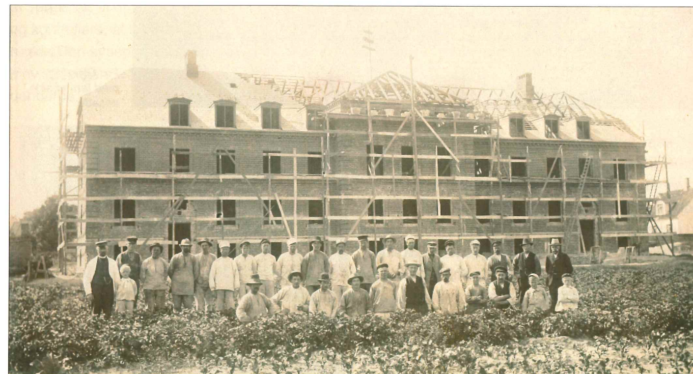
Alderdomshjemmet i Fynsgade anno 1906.

I 1917 blev alderdomshjemmet udvidet, så det nu kunne rumme ca. 90 beboere.