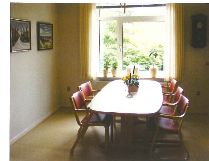
Spisestue på Plejehjemmet Fynsgade før renoveringen.

Personalet var stadig overvejende uuddannede kvinder til trods for en stigende fokus på faglighed.