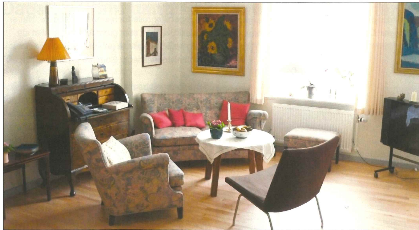
Et kig ind i en stue på Fynsgadecentret.

da medarbejderen kom ind på stuen. Han lod som om, han var blevet en kanin! Eller som bestyrerinden beretter om en ældre mandlig beboer, som ryger pipe og som mange gange taber gløderne og har brændt hul i mange stole og gulvtæpper: