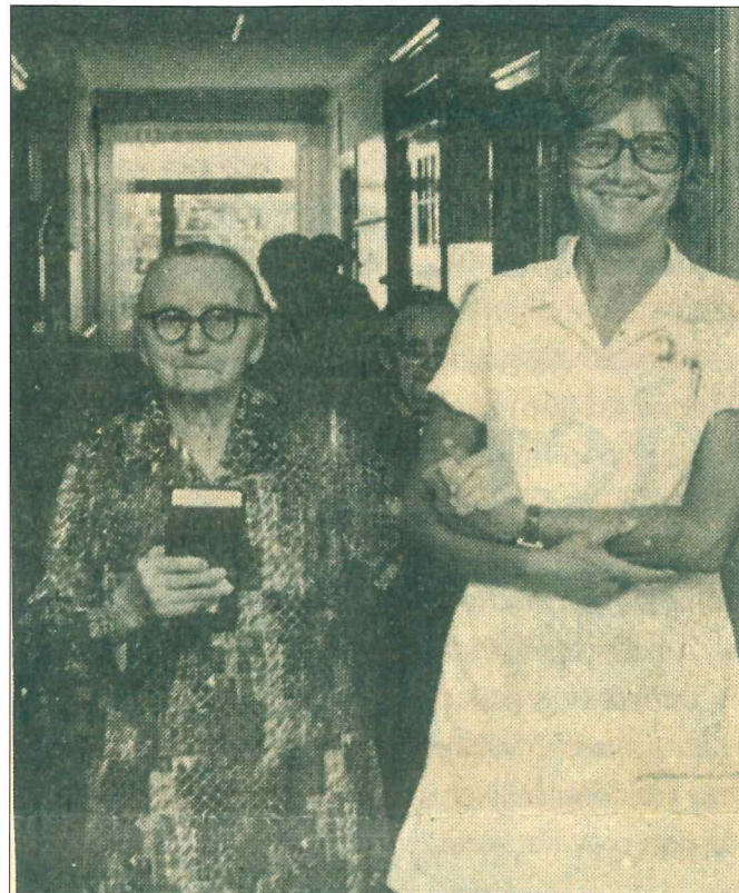
På vej til andagt.

"Her er dejligt om aftenen, stille og fredeligt. Vi har tid til at snakke med de ældre. Vi har kontakt. Jeg er glad for mit arbejde. Et smil fra en ældre, taknemmelighed for mit arbejde, gør mig glad."